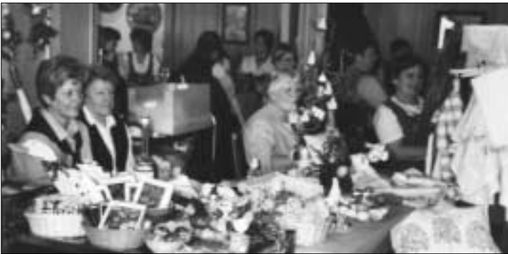
Osterbasar anlässlich der Liebstattdfeier