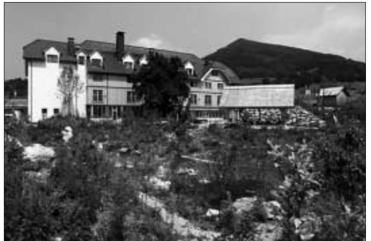
Der Steinschalerhof - Hausansicht Süd mit Garten - ein Ort zum Wohlfühlen