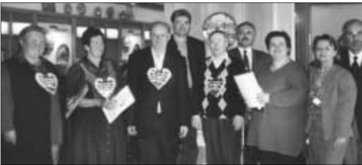
Ehrung langjähriger Mitglieder