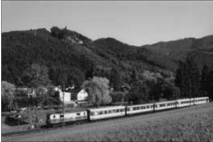
Die Mariazellerbahn „ontour“

Die Mariazellerbahn ist die älteste elektrische Schmalspurbirgsbahn mit der Weltrekordlok (1099 – 90 Jahre!) und sie ist täglich im Einsatz!