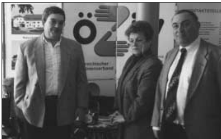
ÖZIV-Stand mit Rollstuhlverleih

dem, Informationen der Linzer Bezirksgruppe und Zuckerl wurde bestens angenommen. Nur so kann man einer breiten Masse von Menschen zeigen, wer wir sind, was wir an Aktivitäten anzubieten haben und