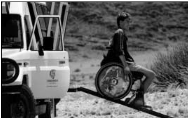
Rampe als Einstiegshilfe