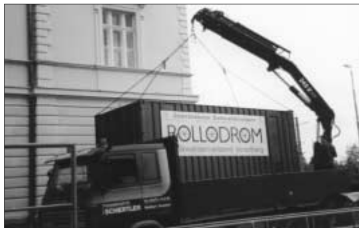
Das Rollodrom kommt in einem Container mit LKW und Eisenbahn zum Aufstellungsort

Das Rollodrom ist ein seit Jahren bewährtes Instrument der Öffentlichkeitsarbeit. Ein Rollstuhlparcours in dem gesunde Menschen er"fahren", welche Hindernisse sich einem behinderten Menschen so in den Weg stellen und wie viel Geschick es