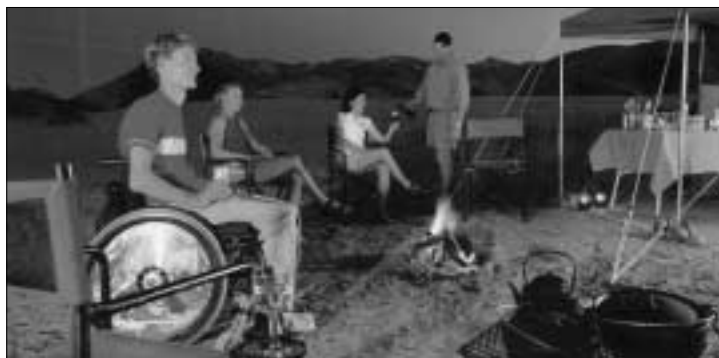
Abendstimmung am Feuer

Dank der Luxuszelte ist man mobil und kann an den schönsten Plätzen übernachten. Die Nächte in den Zelten zu verbringen bedeutet ein unmittelbares Naturerlebnis zu spüren. Vom sicheren Zelt aus hört man das Brüllen der Löwen, die Stimmen von Zebras, Giraffen, Hyänen, Elefanten, Vögel und anderer Wildtiere. Auf unserer Reise ist eine Herde von ca. 40 Elefanten direkt an unseren