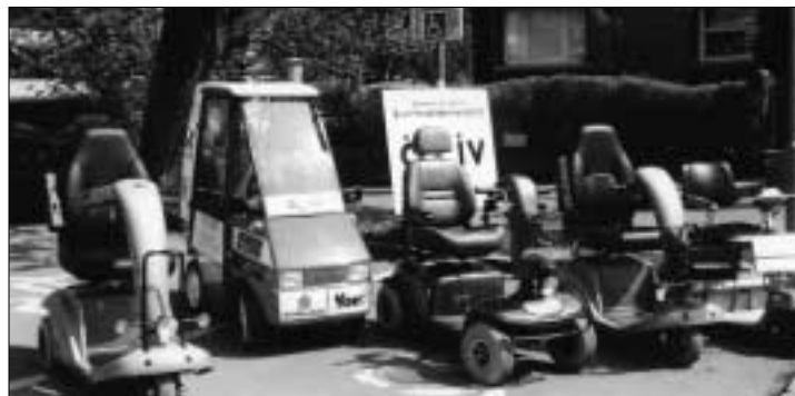
Eine kleine Auswahl unserer Elektroflotte

Die Hilfsmittelzentrale des ÖZIV-Vorarlberg erfreut sich