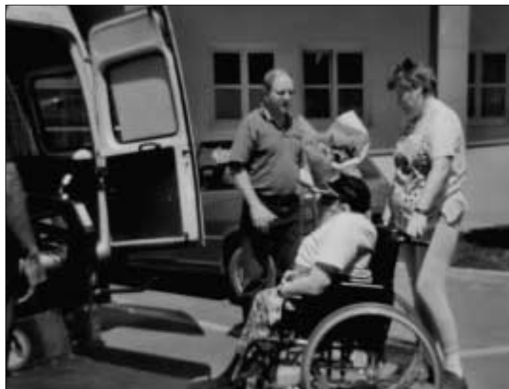
Legende: Support half bei Übersiedlung