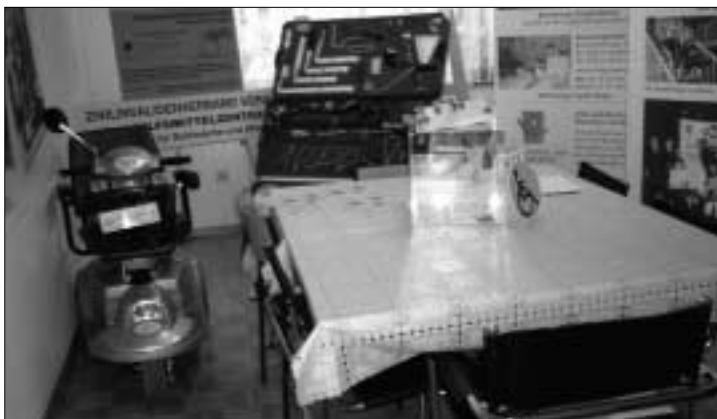
Kontaktraum im Verbandbüro als Schauraum umfunktioniert

Kurzfristig zum Schauraum umfunktioniert wurde der Kontaktraum im Verbandsbüro anlässlich der Aktion „Soziales Netz Bregenz“. Auf Initiative des Vereines Lebensraum gemeinsam mit der Landeshauptstadt Bregenz wurden drei Tage