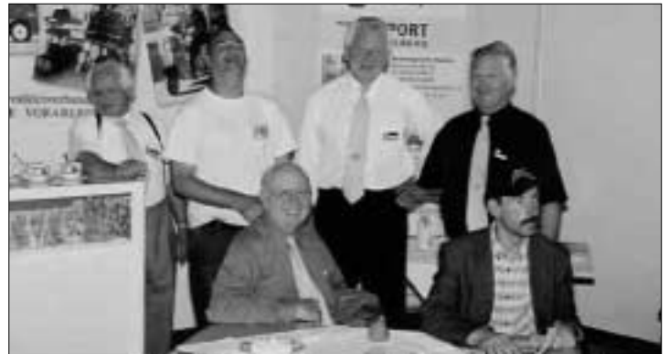
Betrieb am Messestand

so mit dem schon traditionellen Rollstuhlverleih. Bereits seit 11 Jahren ist der ÖZIV-Vorarlberg regelmäßig auf der Messe präsent.