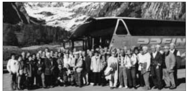
Herbstaufzug der BG Bruck/Kapfenberg