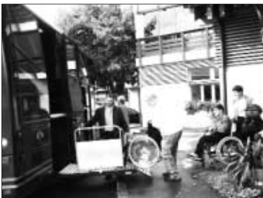
Rollstuhlreisebus in Aktion

dann alle wieder zum gemeinsamen Mittagessen und zu einem vergnügten Nachmittag. Die Kristbergmusikanten sorgten von Anfang an für Stimmung mit Musik und Humor, die Trachtengruppe Vandans erhielt besonderen Applaus für die gekonnten Darbietungen und die schönen Trachten. Allzu schnell verlief der Tag und gegen 17 Uhr standen die Busse wieder zur Abfahrt bereit.