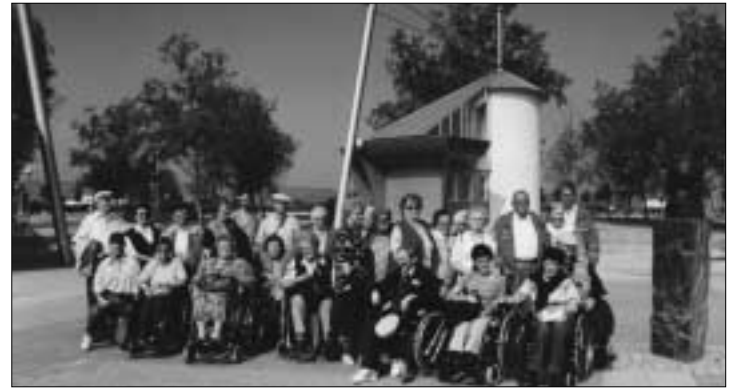
Unsere Reisegruppe in Mörbisch