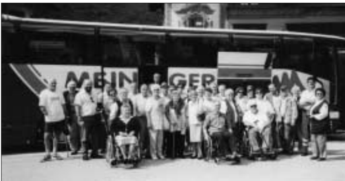
BG Gmunden unterwegs ...