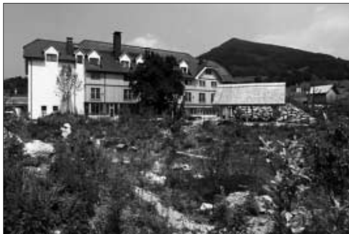
Der Steinschalerhof - Hausansicht Süd mit Garten - ein Ort zum Wohlfühlen