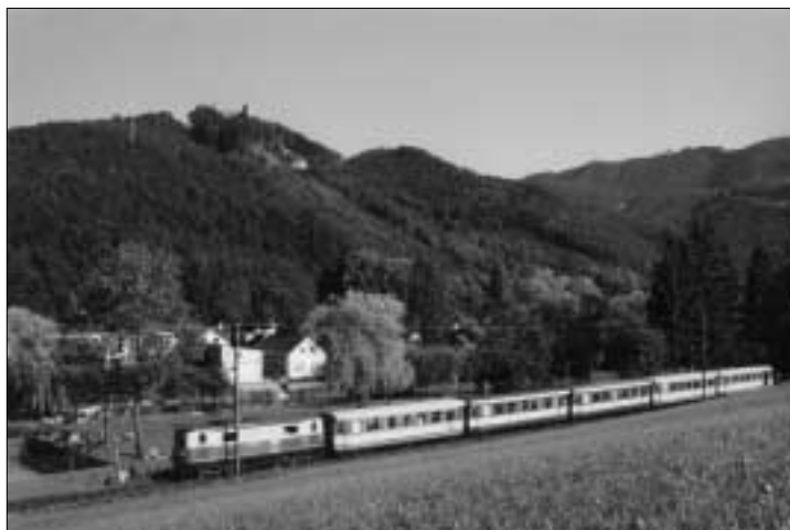
Die Mariazellerbahn „ontour“

Die Mariazellerbahn ist die älteste elektrische Schmalspurbahn mit der Weltrekordlok (1099 – 90 Jahre!) und sie ist täglich im Einsatz!