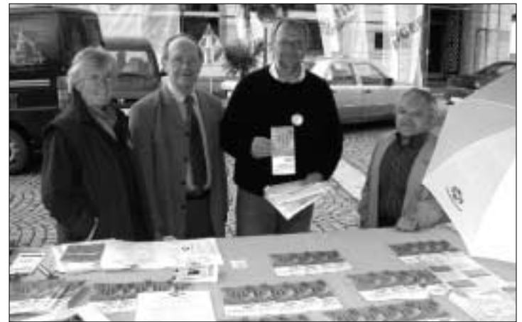
ÖZIV-Stand bei Gesundheitsmesse